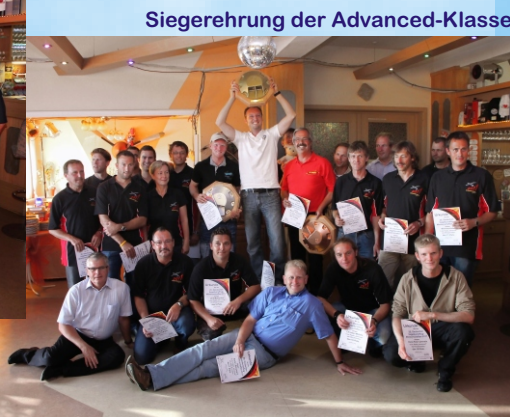
Siegerehrung der Advanced-Klasse